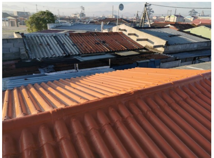
Die huis se dak wat herstel is.