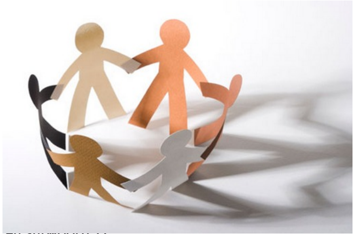
en antwoord ty.

Wanneer Paulus oor die moeilike en swaarkrytye in sy lewe reflekteer, is dit ook dié denke wat telkens in sy briewe aan die eerste gemeentes resoneer. Dit bring 'n mens nader aan God om te besef dat ons te midde van alles wat in die lewe gebeur, nooit geskei kan word van die Here se genade nie. God se krag kom juis in ons tot werking wanneer ons swak is. Daarom sê Paulus in 2 Korintiërs 12:10: “. . . want as ek swak is, is ek sterk”.