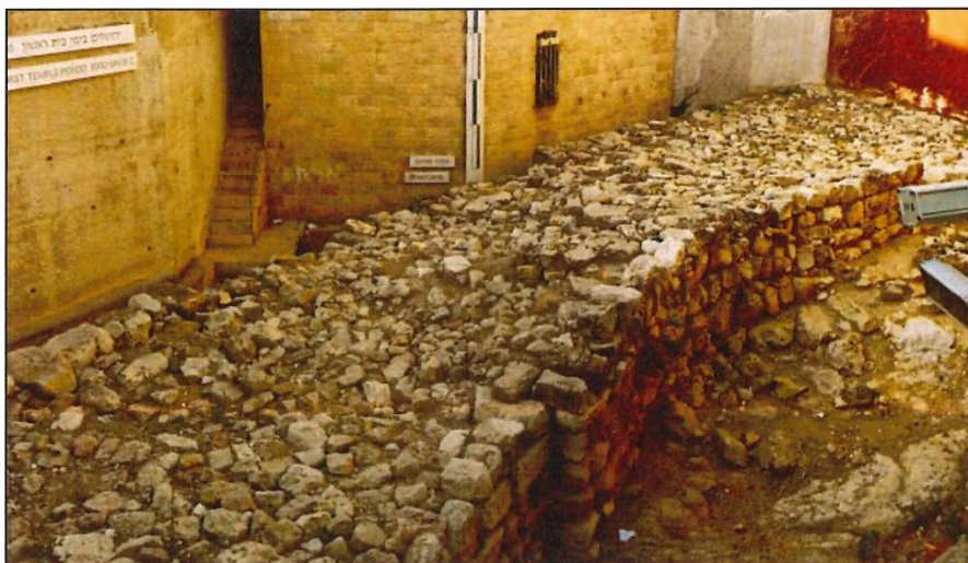
Figuur 2. 'n Muur in Jerusalem wat koning Hiskia laat bou het om vir die Assiriese aanval voor te berei.