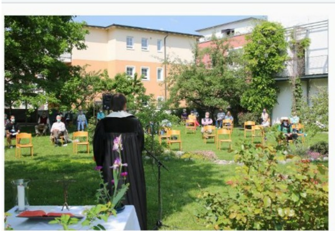
'n Buitelug hemelvaartdiens tydens die Covid-19- inperkings in Duitsland word deur die Evangelies-Lutherse Kerk in Fürstenfeldbruck, aangebied