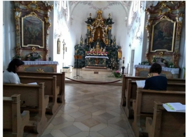
'n Katolieke Kerk in Augsburg, Bavaria hou 'n Paasdiens met slegs drie vroue in die kerk.