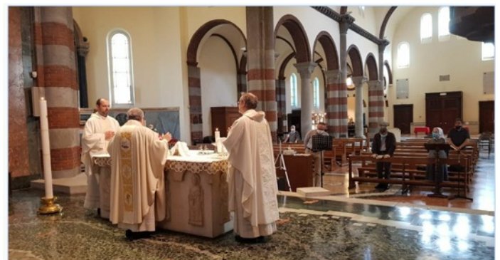
'n Erediens in 'n leë St. Paulus Katedraal in Milaan, Italië.