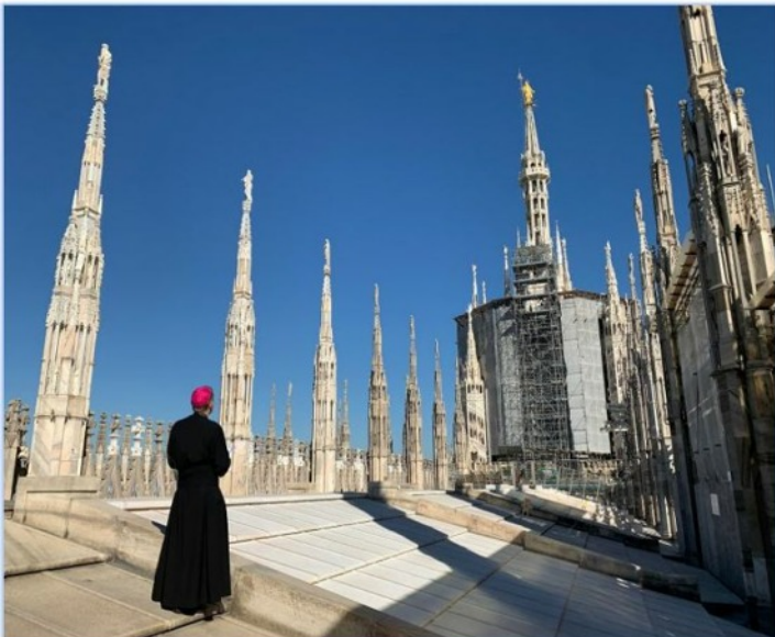
Die Aartsbiskop Delpini bid op die dak van die Duomo in Milaan vir die beskerming van die stad tydens die Covid-19-pandemie.