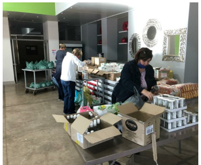
Foto links: Die 430 kg hoenderborsies wat as skenking ontvang is, is onder gesinne in Ysterplaat versprei. Foto regs: Ons span getroue kospakkers is besig om pakkies niebederfbare kos te verpak.