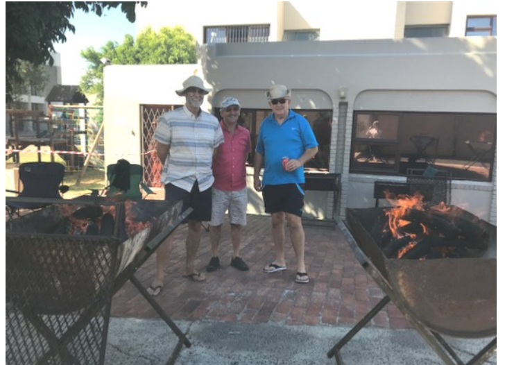
Foto links: Die weer het saamgespeel en basaar besoekers kon tot lekker laataand onder die mooi volmaan kuier.

Foto regs: Ons braaispan. Hoe hou 'n mens dan nou basaar sonder braaiers?